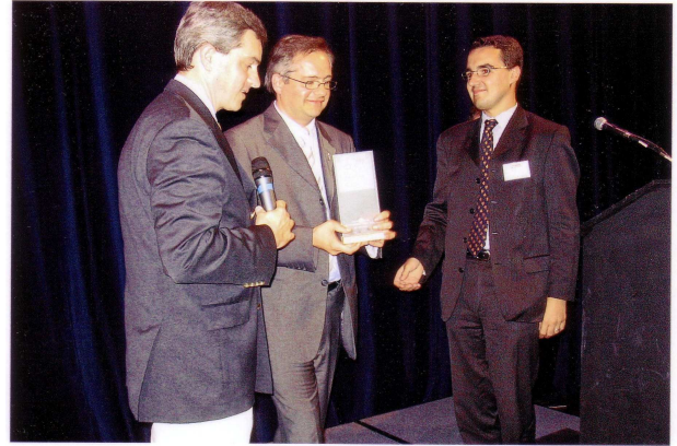
Remise du prix

Après plusieurs années d'efforts, la restauration de la crypte de Notre Dame de Lourdes de Sotteville-lès-Rouen où figurent les portraits des soldats de 1914-1918 sur vitraux est en bonne voie. La paroisse de Sotteville a obtenu un prix de 9 395 € au concours "Patrimoine pour demain" organisé par le magazine " Le Pèlerin ". Cette somme s'ajoute à la subvention de 18000 € du Conseil Général, aux dons divers et à la souscription ouverte. Le démontage des vitraux a donc commencé le 7 juin. Le lien entre cette crypte et Join-Lambert est indéniable. En effet sur la liste des soldats morts au champ d'honneur figurent en autres les noms de professeurs et de plusieurs élèves de Join-Lambert ainsi que celui de nombreux prêtres du diocèse de Rouen.